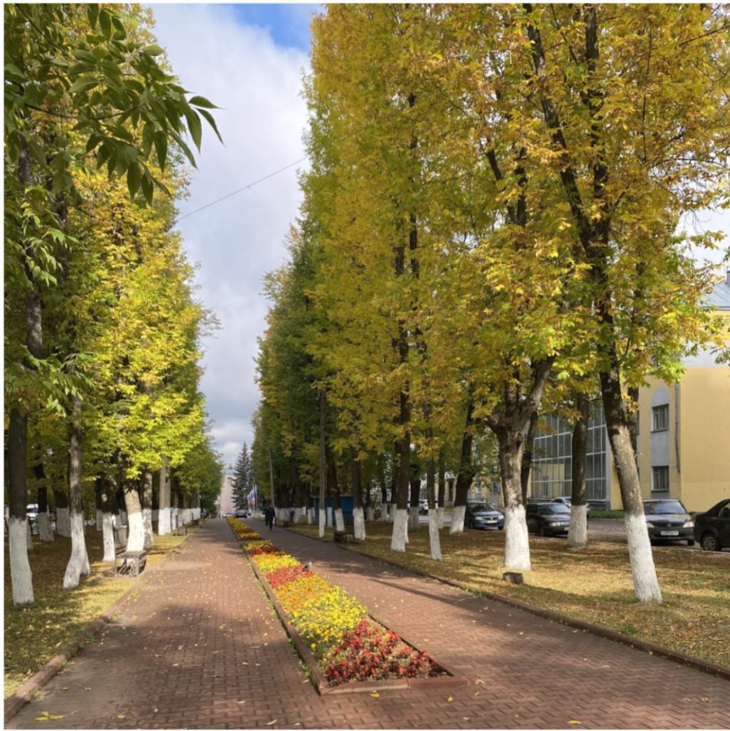
Липовая аллея, заложена в 1934 г.