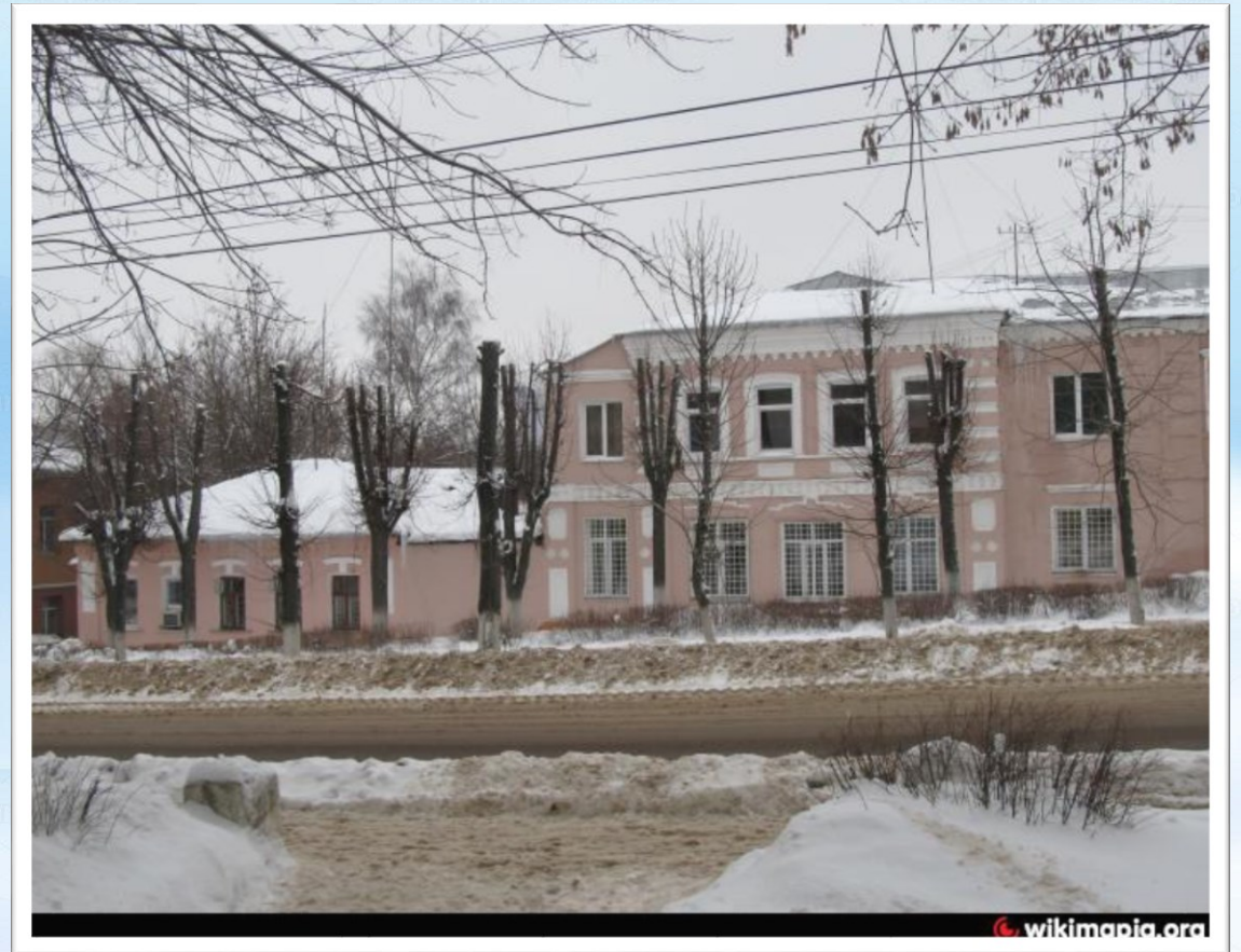
Ресторан Шувалова, 19 в. (ныне здание полиции)