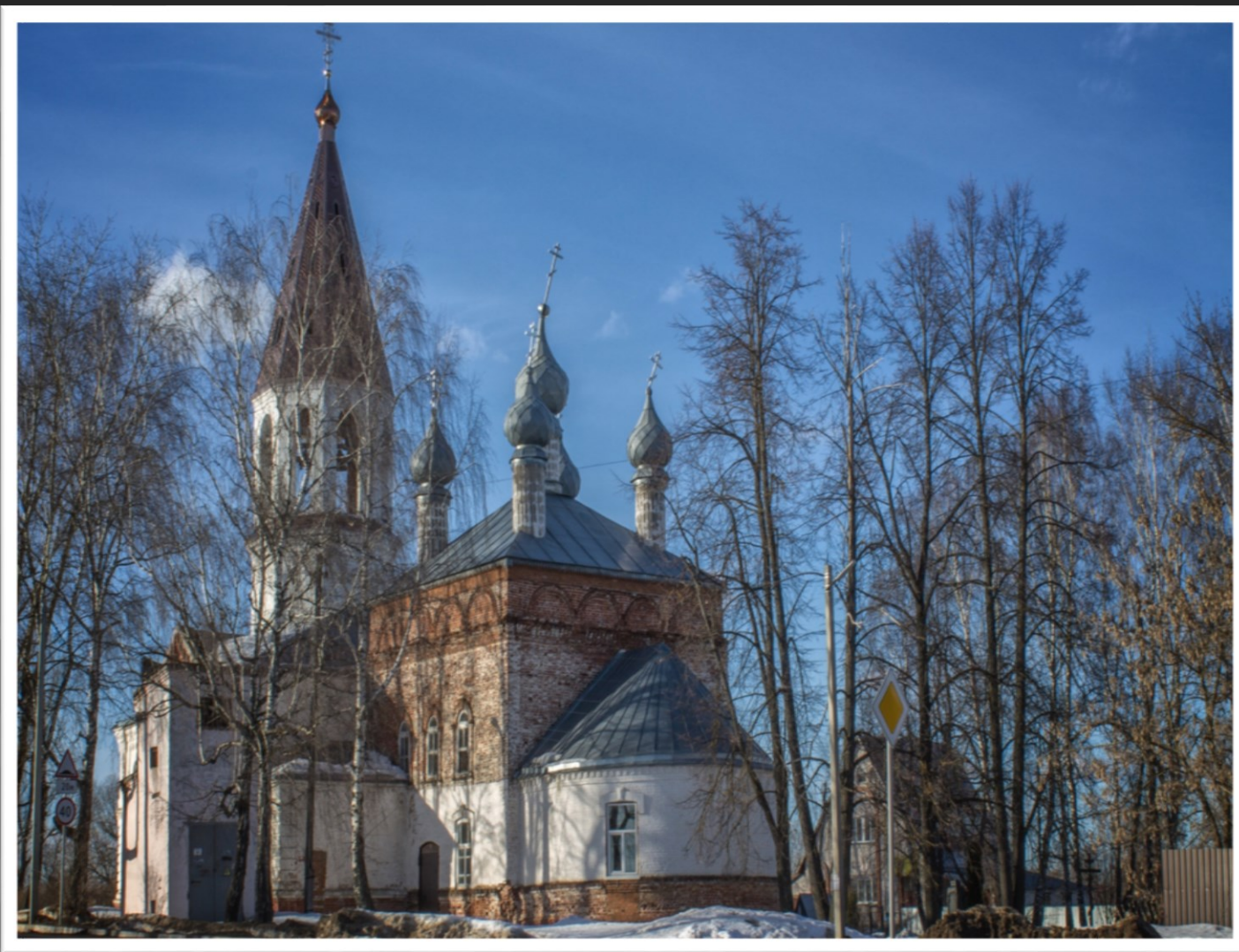
Храм Вознесения, 19 в.