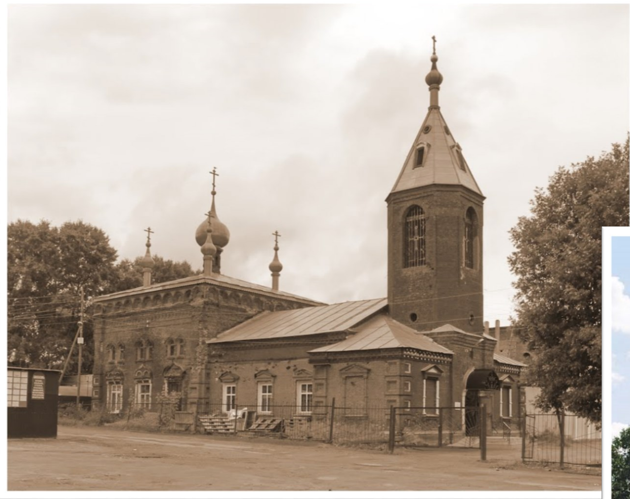
Храм Покрова Пр. Богородицы (бывший Троицкий, старообрядческий), 1907 г.