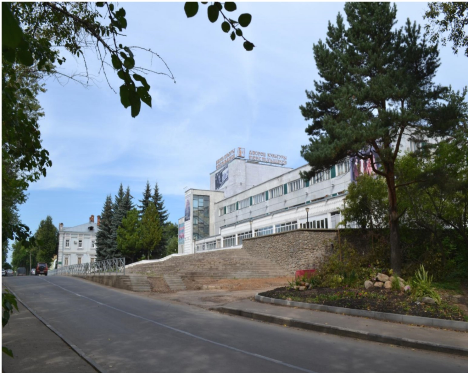
Дворец культуры, 1977 г.