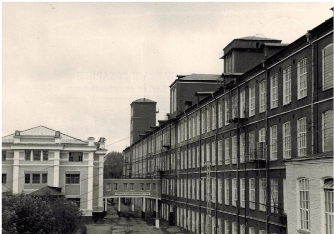
«Т-во мануфактур Бр. Г. и А. Горбуновых», 1869 г.