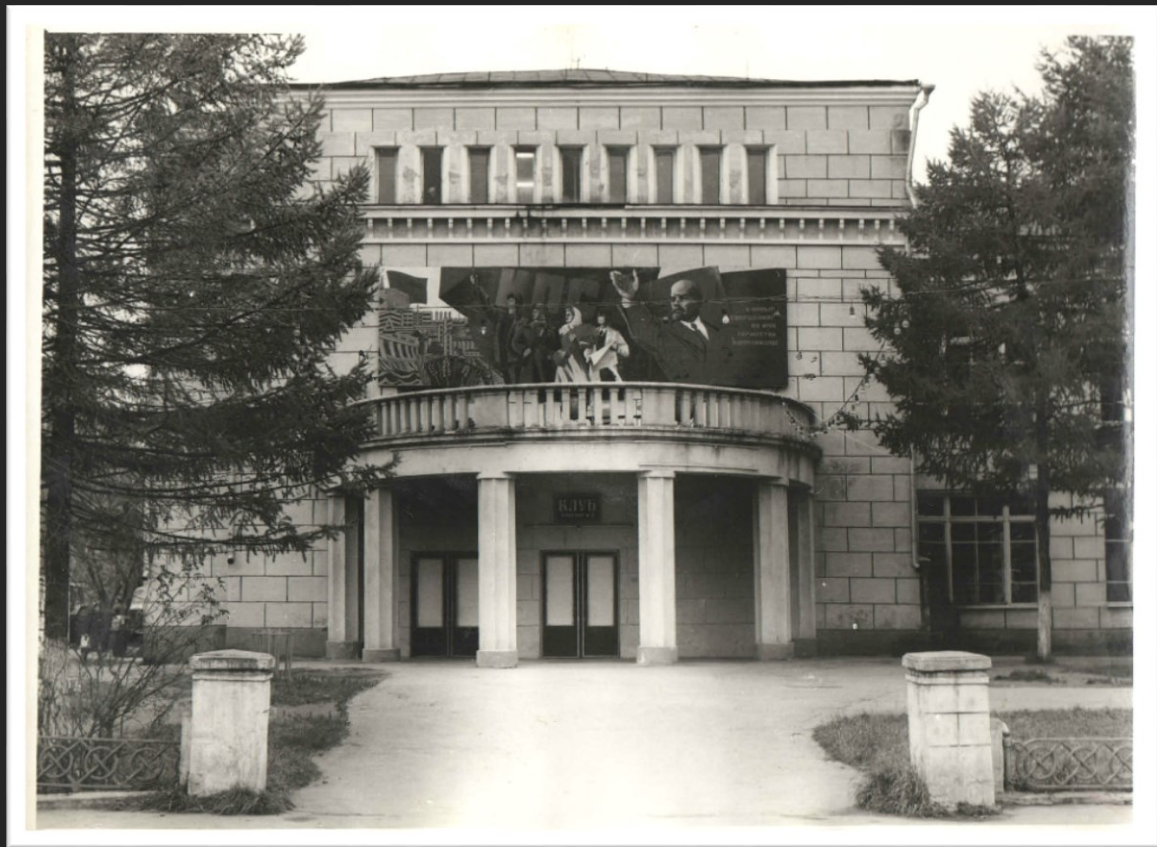
Здание бывшего Дома культуры, 1949 г.