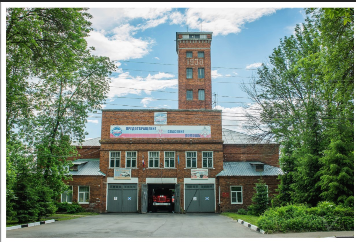
Здание пожарной части, 1938 г.