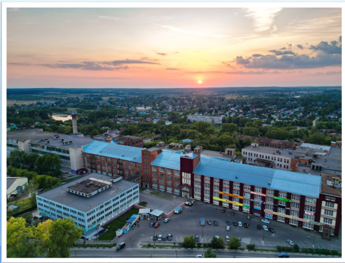
ул. Социалистическая (Преображенская)

Памятник писателю Д.А. Фурманову (скульптор Н.В. Дыдыкин, 1960 г.)