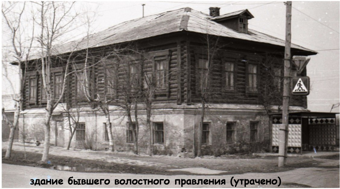
здание бывшего волостного правления (утрачено)