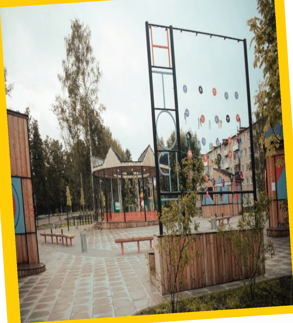
Площадь «Новый торг»