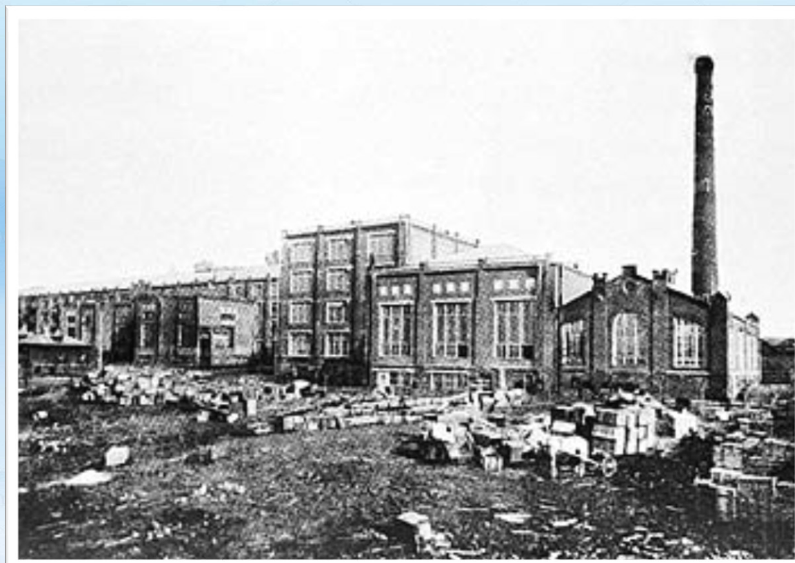
«Т-во мануфактур, основанных И.И. Скворцовым», 1871 г. (ныне ф-ка 1)