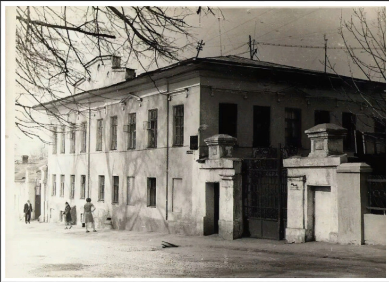
Особняк фабрикантов Клементьевых, 19 в. (ныне военкомат)